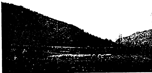
Valle del río Cárdenas

E tapa media de 16,5 kilómetros, que a través de un suave recorrido une las localidades de Ezcaray y San Millán de la Cogolla, pasando por Turza, Pazuengos y Lugar del Río. Ezcaray, núcleo asentado a los pies de la S ª de la Demanda, tuvo un importante pasado industrial en la confección de tejidos, que ha dado paso en la actualidad a una creciente actividad turística gracias a su importante patrimonio natural, tanto de carácter veraniego como invernal con la Estación de Valdezcaray.